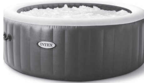
FIGURE 1 – Photographie du spa étudié

La pandémie de COVID-19 a profondément changé la consommation de loisirs des français. N'étant pas sûrs de pouvoir voyager ou que les campings et plages soient accessibles, nombreux sont ceux qui ont cherché à se procurer du bien-être dans leur propre habitation en achetant une piscine ou un spa gonflable. Dans ce problème plusieurs aspects de l'utilisation du spa sont abordés, de la première installation au stockage hivernal.